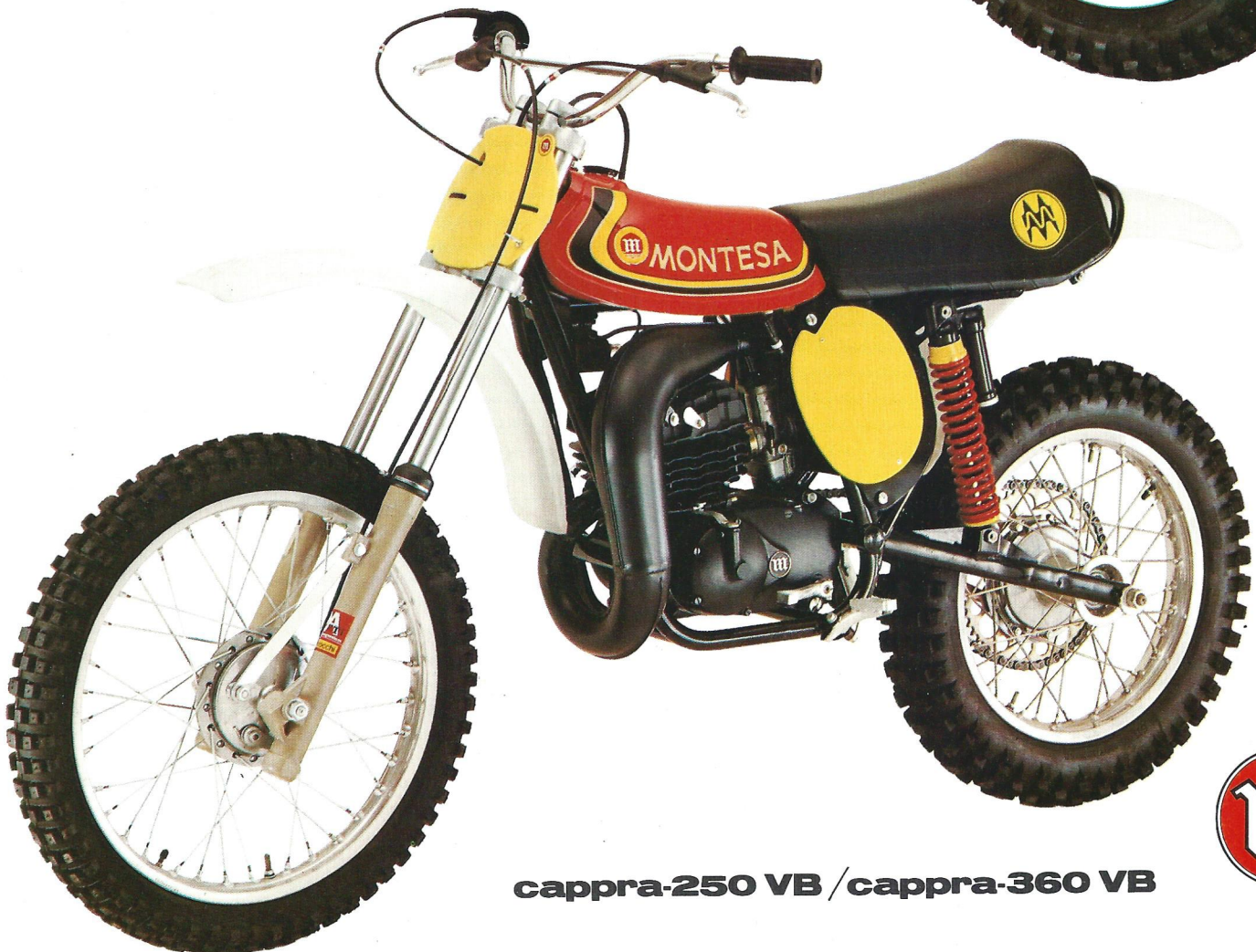
cappra-250 VB / cappra-360 VB